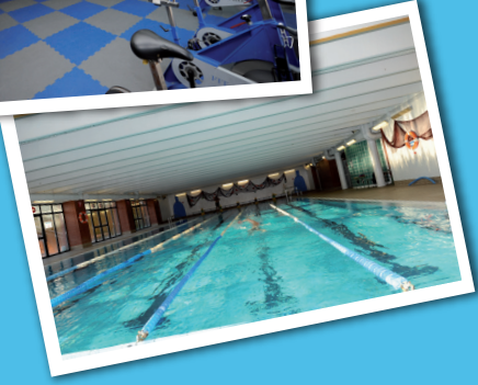
Igerilekua / Piscina

Gimnasioak: kardiobaskularra eta muskulazioa